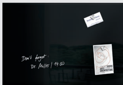
GL 120 // 60 x 40 cm