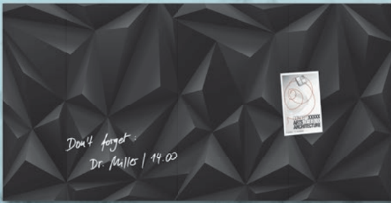
GL 261 // Design Black-Diamond // 91 x 46 cm