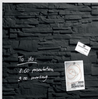
GL 196 // Design Schiefer-Stone // 48 x 48 cm