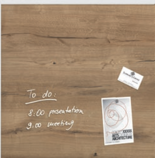
GL 254 // Design Natural-Wood // 48 x 48 cm