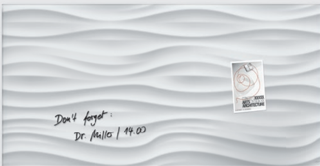
GL 260 // Design White-Wave // 91 x 46 cm