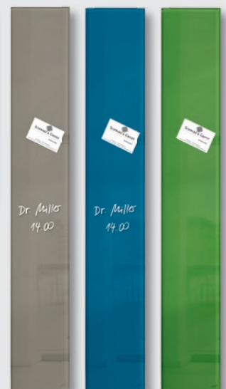
GL 108 // 12 x 78 cm